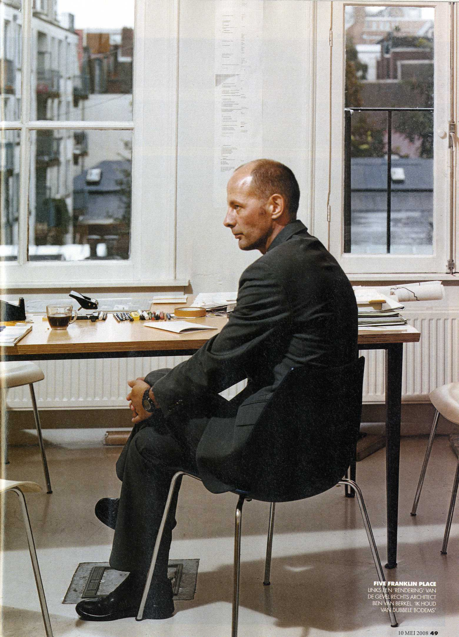
FIVE FRANKLIN PLACE LINKS EEN 'RENDERING' VAN DE GEVEL RECHTS ARCHITECT BEN VAN BERKEL. 'IK HOUD VAN DUBBELE BODEMS'