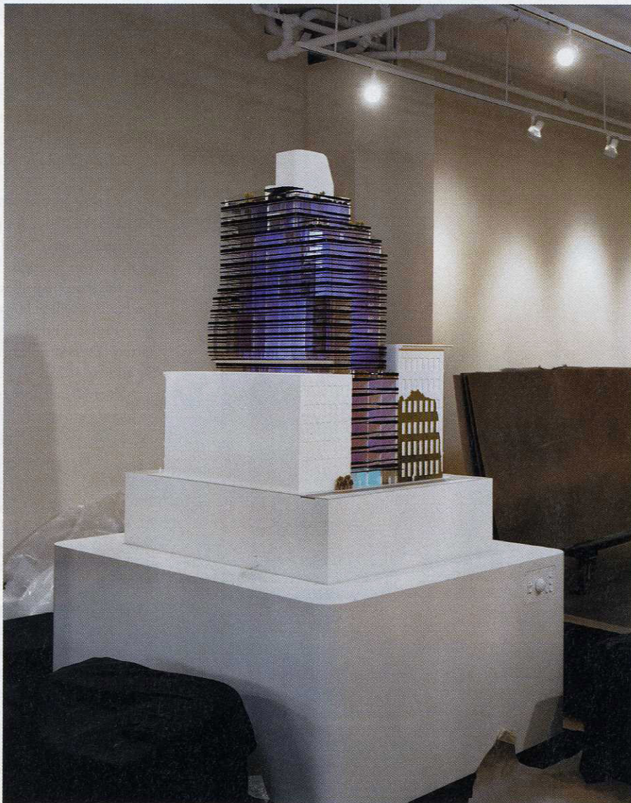
SATIJNEN LINT MAQUETTE VAN FIVE FRANKLIN PLACE: ALSOF ER EEN CADEAU STAAT

buurt zo goed. Ik heb daar zo vaak gelopen, zuidwaarts over Broadway, met dat uitzicht op de Woolworth Tower.' Op zijn negentiende was hij er voor het eerst. 'Ik studeerde nog vormgeving aan de Rietveld Academie. Het was niet zozeer de architectuur die indruk maakte, het was vooral het landschap dat al die torens samen vormden. De zware schaduw die ze werpen. Alsof je door diepe ravijnen loopt.' Een idee over wat hij er zou bou-