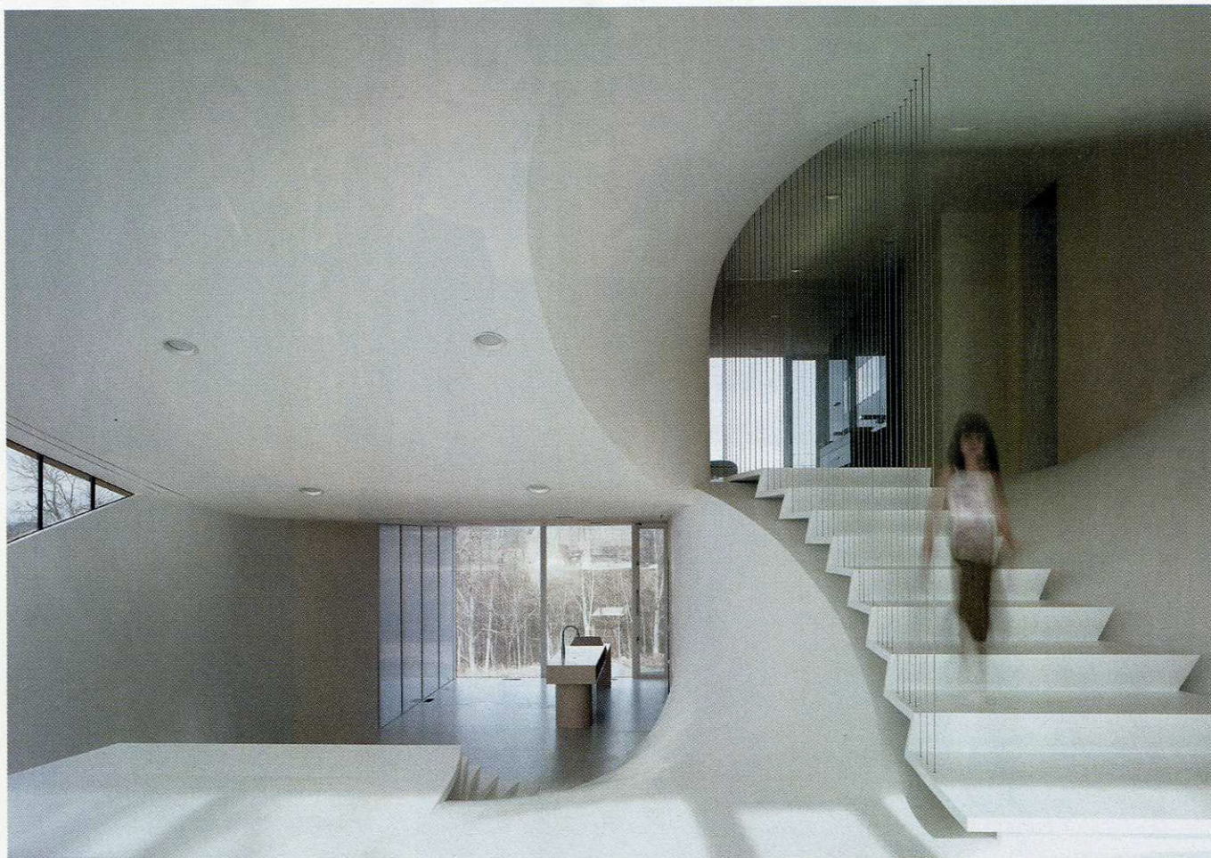
CHRISTIAN RICHTERS/UN STUDIO