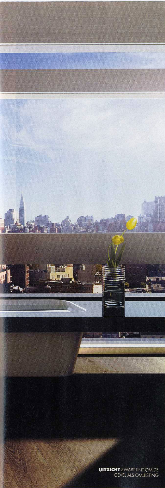
UITZICHT ZWART LINT OM DE GEVEL ALS OMLIJSTING